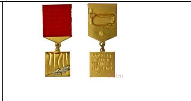
Знак «Лауреат премии Ленинского комсомола»